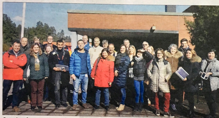
Grupo de profesores participantes en el programa en Finlandia.

Este viaje tuvo lugar en abril del pasado año. Tres profesores del instituto talaverano realizaron una visita de estudio o curso de observación de buenas prácticas organizada por la institución Euneos dentro de las actividades programadas en el proyecto KA-101 Junto con otros profesores portu- gueses,