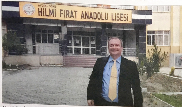
Uno de los docentes en Turquía.