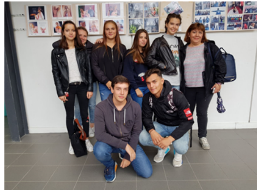
Alumnos de intercambio españoles y franceses en la entrada de la Biblioteca.

reunirse para realizar trabajos en grupo. Yo aproveché la ocasión para reunirme en dos ocasiones con nuestros alumnos de intercambio para comprobar cómo se desarrollaba su estancia en el centro.